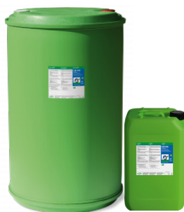
N° article 578540-V-50-O Fût 200 l