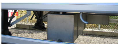
Bac de rétention

permettant l'écoulement et la collecte des liquides. Grâce à ce dispositif de sécurité, tout risque de pollution dû à un écoulement imprévu est exclu.