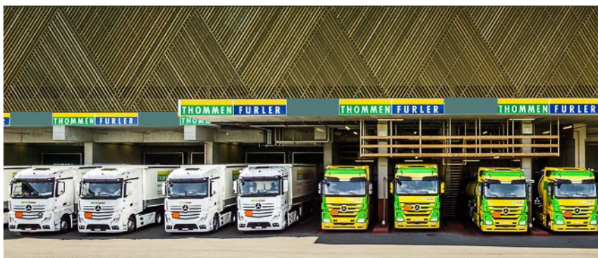
Blanc: Camions bâché, Jaune/vert: Camions citernes

Pour Thommen-Furler AG, la qualité, la sécurité, la ponctualité ainsi que la fiabilité sont les fondements pour un service à la clientèle optimal.