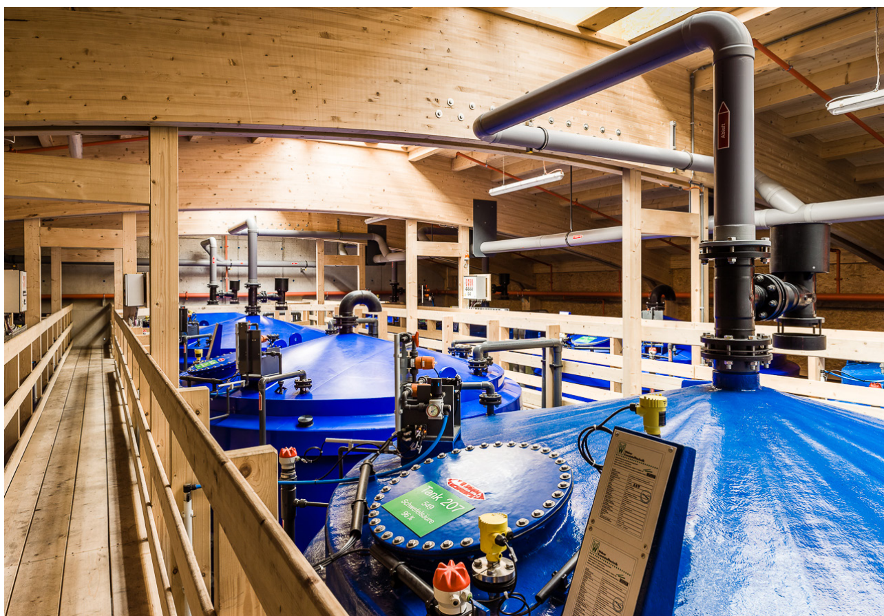
OptiTank® - Gestion des citernes par télémétrie

Les clients peuvent faire totalement confiance aux prestations de Thommen-Furler AG pour une gestion sans souci mais pas insouciance de leurs produits chimiques et de leurs déchets spéciaux.